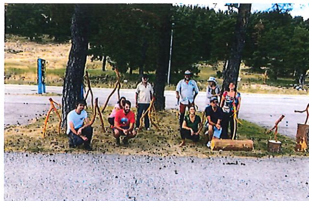
Les organisateurs, les intervenants et les différents artistes de cette journée LAND ART.

Les peintures naturelles à l'ocre, de ces branches inversées, donnent une note naturelle à l'ensemble